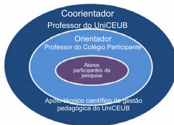
Figura 1 – Matriz Tridimensional de integração do processo de orientação do Programa PIC/Júnior

Em 2012, o Programa teve a sua estratégia ampliada. Contou com um coorientador do UniCEUB e um professor do colégio participante do Programa, orientando diretamente os alunos em uma cooperação tridimensional. Essa metodologia permitiu criar equipes integradas de pesquisa.